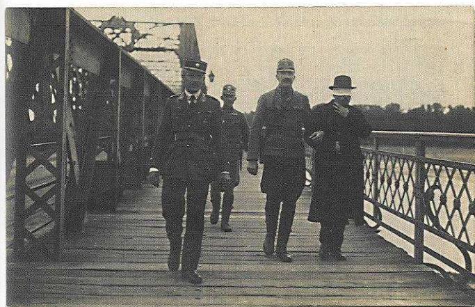
Udalosti z roku 1919