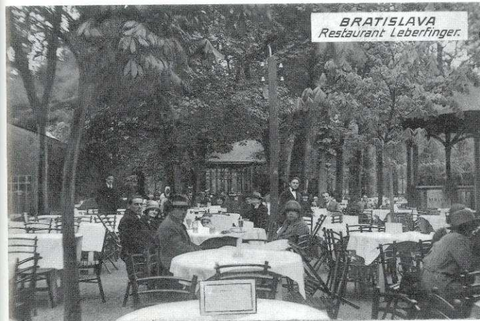
Hostinec Leberfinger v petržalskom parku