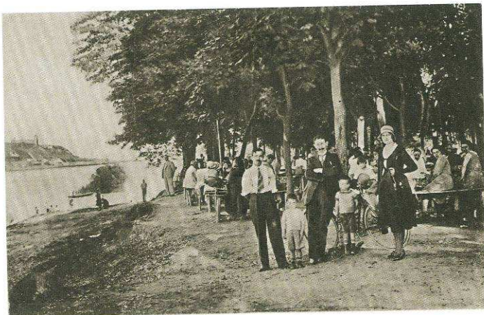
Výletná reštaurácia Krištofek (vľavo v pozadí Hrad), okolo roku 1930