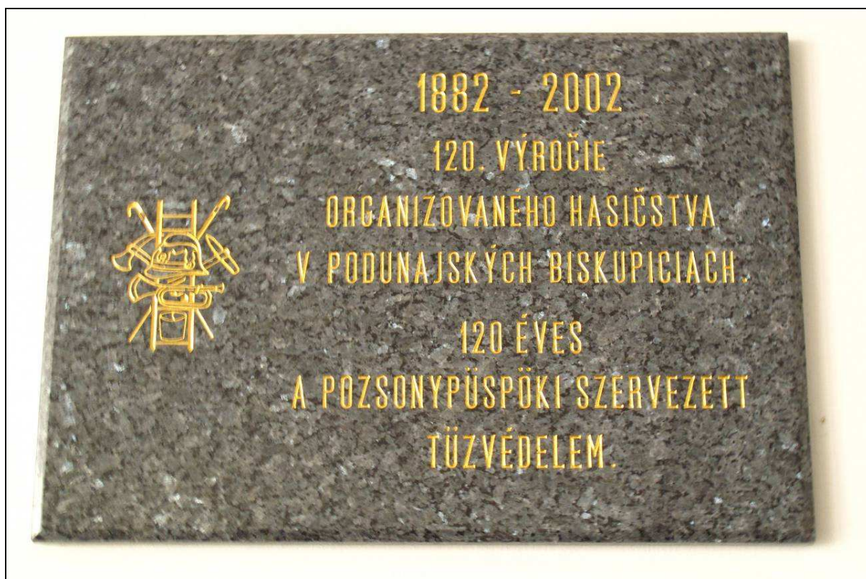
Pamätná tabuľa organizovaného hasičského zboru