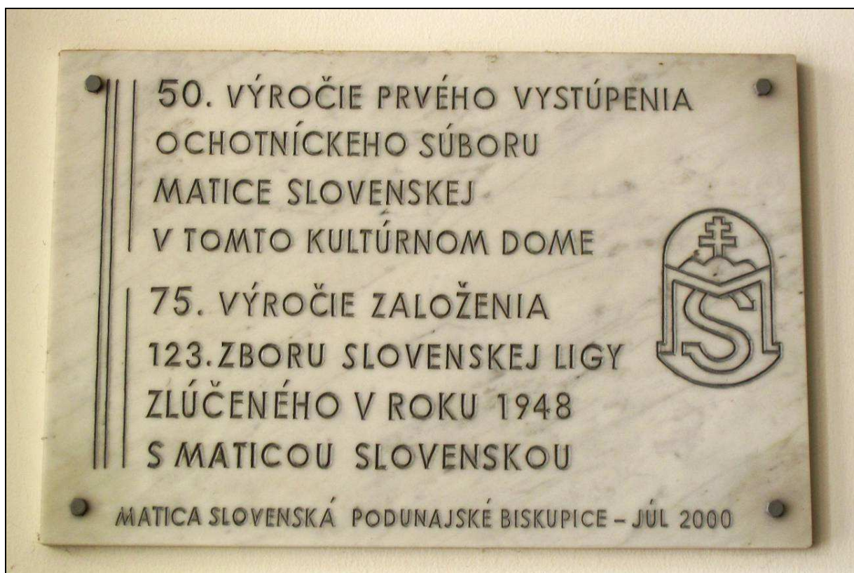
Pamätná tabuľa Matice slovenskej