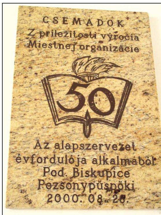
Pamätná tabuľa Csemadoku