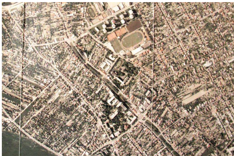
Letecká snímka Pod. Biskupíc z r.2009 (výrez)