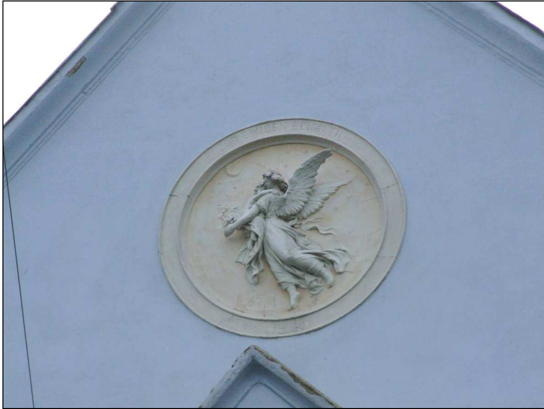
Reliéf anjela na čelnom štíte