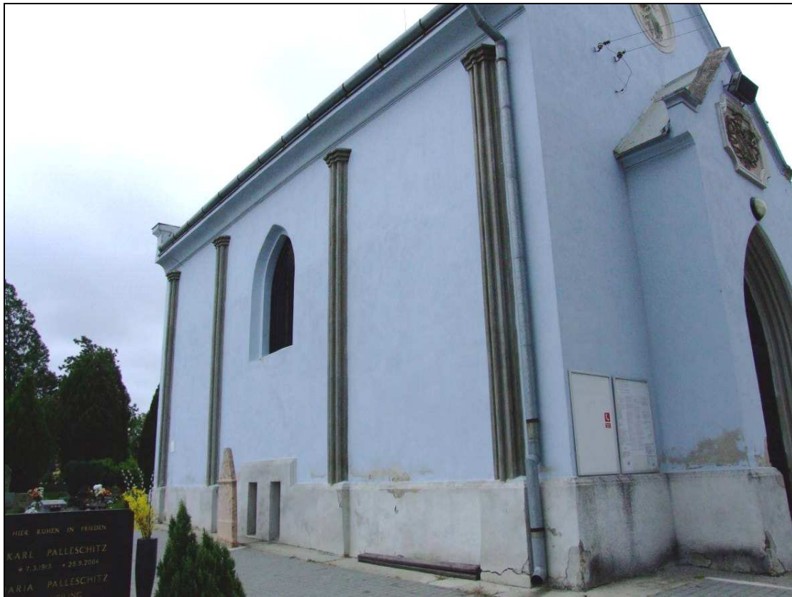
Bočný pohľad na kaplnku