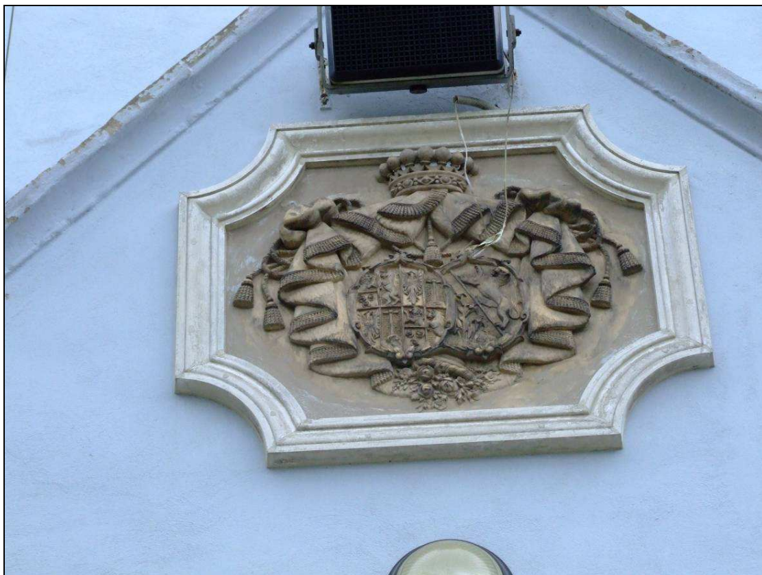
Erb rodiny Henckelovcov