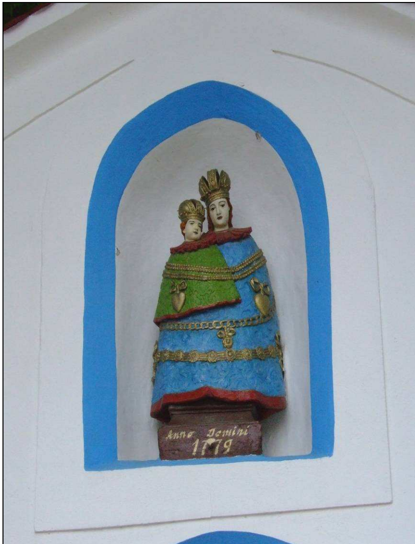
Brána na cintorín, socha Panny Márie s Ježiškom